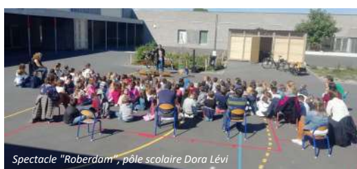
Spectacle "Roberdam", pôle scolaire Dora Lévi