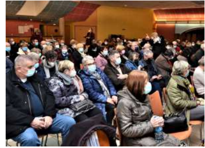
160 spectateurs pour Bulles de Swing – 01/2022