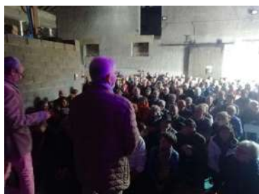
Festival "coup de théâtre en Ardennes" à Boult aux bois