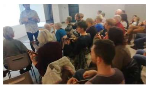
Nouvelle formule apéro Ukulélé – 12/2022

Association culturelle les Tourelles – 04/2023