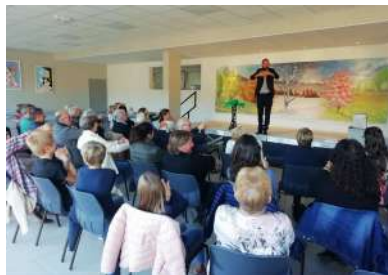
Professeur T à Bayonville – 11/2022