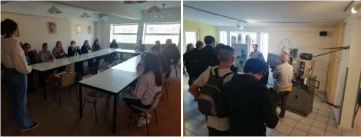
Visites mensuelles des locaux de l'espace culturel pour des jeunes en insertion professionnelle