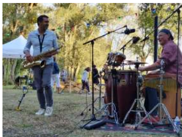
"à l'est de la plage" à Bairon – 08/2022