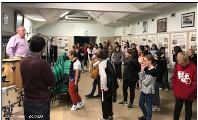
PAG Fanfare – 09/2022