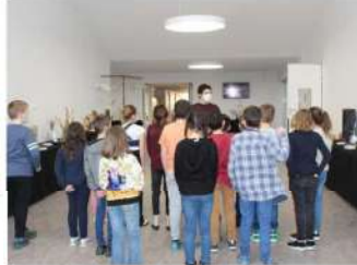
Il faut en faire l'opportunité de Dora-Levi, sans oublier les parents qui doivent continuer leur rôle.

VOUZIERE Le pôle scolaire Dora-Levi dispose d'un hall d'accueil qui va passer plus de 400 personnes par jour. Un attrait pour y créer des événements culturels.