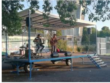
Concert au parc Bellevue – 21/06/2022