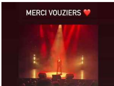
Salle comble pour Liane Foly et le Mitch en 09 et 10/2022