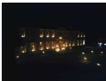
"Si l'abbaye m'était contée" – 10/2022