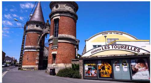
Association culturelle les Tourelles – 04/2023

Nous avons œuvré toute l'année avec la Mission Locale pour ouvrir notre association aux plus jeunes générations.