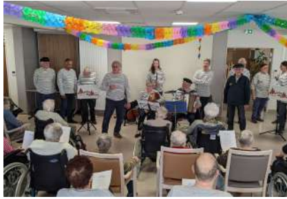
Concert de chants marins à l'EPADH – 03/2022