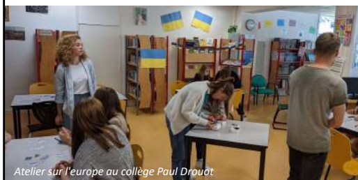
Atelier sur l'europe au collège Paul Drouot